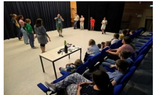
Photo : Atelier Théâtre au CSC Sarrebourg - Mai 2025